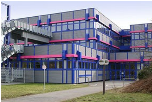
Geschwister Scholl Schule Blieskastel