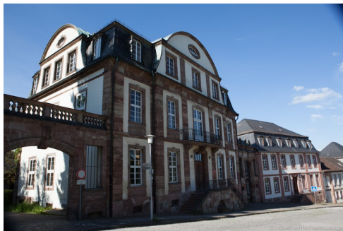
Von der Leyen-Gymnasium Blieskastel